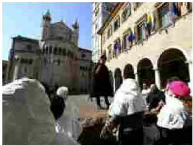
"Io, Mutina": torna il viaggio spettacolo sulle tracce della Modena di un tempo