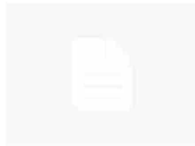
300 studenti coinvolti nella gara di greco e latino, sabato le premiazioni al Muratori-S.Carlo